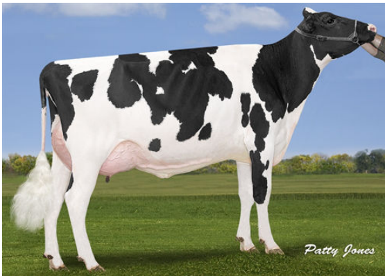
VOGUE OCTANE SUNSTRUCK