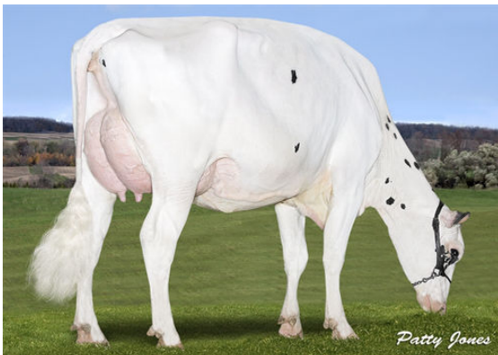
STANTONS OCTANE LACASSA